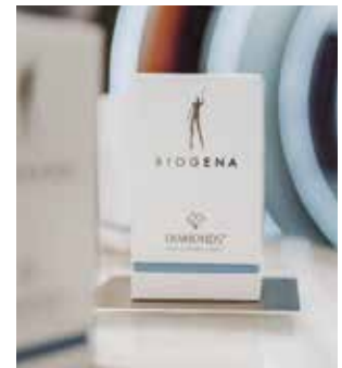
Bild oben: In der BIOGENA Brand Base 01 in Salzburg kann man in der Welcome-to-Yourself-Tube seine persönliche Gesundheit multisensorisch entdecken.

Online-Shop und weitere Informationen unter biogena.com