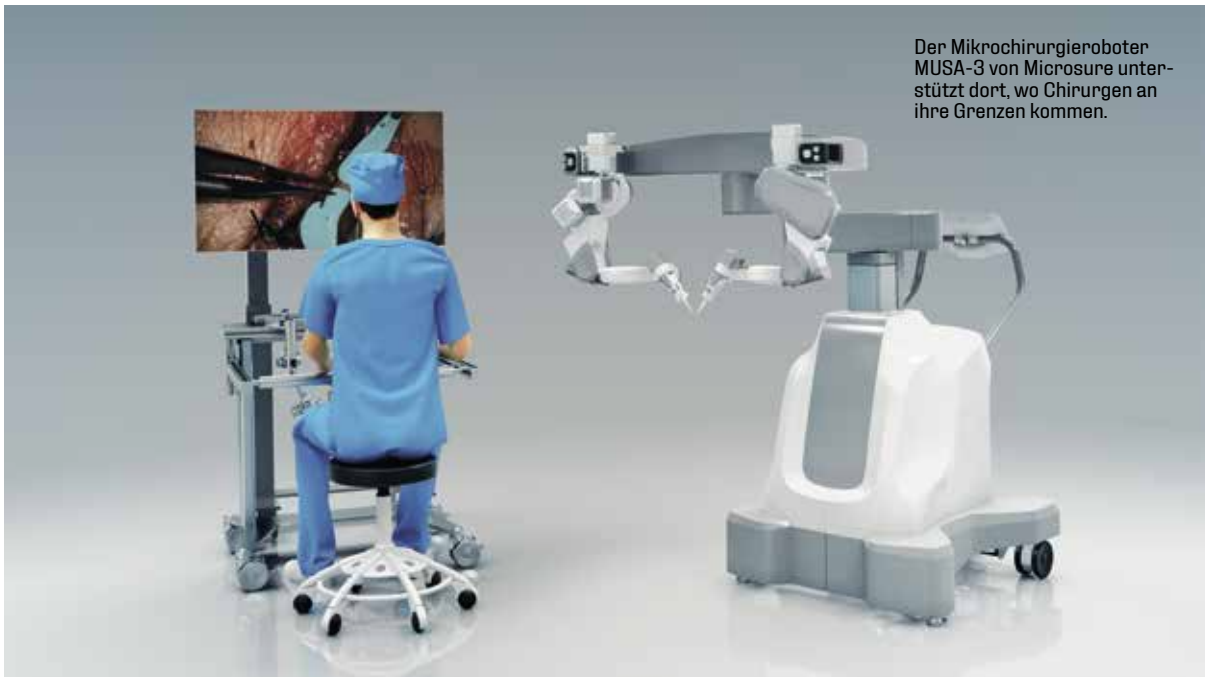
Der Mikrochirurgieroboter MUSA-3 von Microsure unterstützt dort, wo Chirurgen an ihre Grenzen kommen.