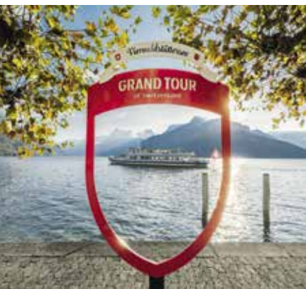
Beste Aussichten am Vierwaldstättersee in Ingenbohl.

Auf ein gutes Miteinander Das Projekt „Alpwirtschaft & Tourismus Kanton Schwyz“ der Schwyz Tourismus AG steht für ein respektvolles Verhalten im Alpengebiet. Der Tourismus ist eine wachsende Branche im Kanton Schwyz. Allerdings kommt es wegen der Touristen auch vermehrt zu Konflikten: Da geht es etwa um Müll, zertrampeltes Weideland oder falsches Verhalten gegenüber dem Vieh. Wie man Verständnis und Rücksichtnahme, aber auch gelungene Kommunikation fördern kann, was optimale Besucherlenkung und passende Gästeangebote sein könnten, damit der Alpbetrieb trotz Touristen reibungslos funktioniert, das versucht man zu evaluieren und befragt dazu Alpenbewohner des Kantons. schwyz-tourismus.ch