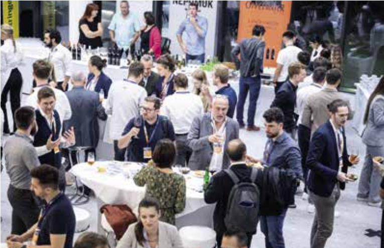
Neben Key Notes, Pitches und Workshops wurde zum Networking eingeladen.

Bereits zum 28. Mal lud die HKSÖL zum entspannten, hochkarätigen „Friends 4 Friends Netzwerk“-Abend – dieses Mal im Rahmen des Events „Expedition KI 2.0“.