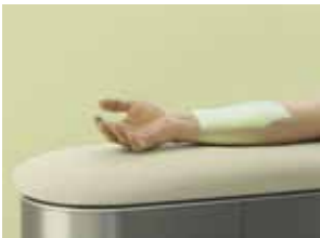
Mit dem Neko Body Scan wird die Gesundheitsvorsorge auf eine neue Ebene gebracht.