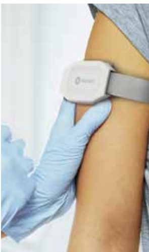
Mit den Lab-on-Skin™ Sensorchips von Xsensio können Wearables laufend biochemische Daten des Trägers sammeln und analysieren.