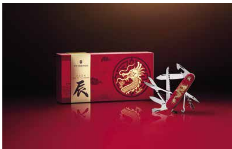
Das weltberühmte Traditionsunternehmen Victorinox hat seinen Hauptsitz in Ibach und feiert aktuell 130-jähriges Jubiläum.

Vorzeigeunternehmen in Schwyz sind etwa Estée Lauder, Man Investments, OC Oerlikon oder BASF Agro. Viele der hier ansässigen Firmen kommen aus der Gesundheitstechnologie und dem Finanzbereich, aber auch Informations- und Kommunikationstechnologie, Maschinen, Zentrale Dienste, Blockchain/Künstliche Intelligenz sind hier vertreten. Man schätzt neben der guten Infrastruktur und der hohen Lebensqualität auch die Nähe und gute Anbindung zum Züricher Flughafen. Der Kanton Schwyz übernimmt zudem eine aktive Rolle im Wissens- und Technologietransfer. Exzellente Hochschulen und Universitäten in der Nähe bieten hoch qualifiziertes Personal und spannende Zusammenarbeit. Schwyz ist Teil des Wirtschaftsraums Zürich. Ein sehr erfolgreicher, wie die Zahlen beweisen: Während die Firmenbestände in der Schweiz für 2021 im Jahresvergleich um 3,4 Prozent gewachsen sind, lag das prozentuale Wachstum im Kanton Schwyz mit 4,7 Prozent an der Spitze. Neben der steigenden Zahl an Newcomern im Firmenbereich finden sich in Schwyz auch weltberühmte Traditionsunternehmen wie etwa die Messerschmiede Victorinox oder die Swissbiomechanics AG, nach eigenen Angaben ein Spin-off der ETH Zürich, das aus dem Familienunternehmen Kryenbühl mit 60-jähriger Erfahrung rund um den Fuß entstanden ist. Produziert und erforscht werden Maßeinlagen und Schuhwerk auf höchstem Niveau; oberstes Ziel ist die Erhaltung einer schmerz-